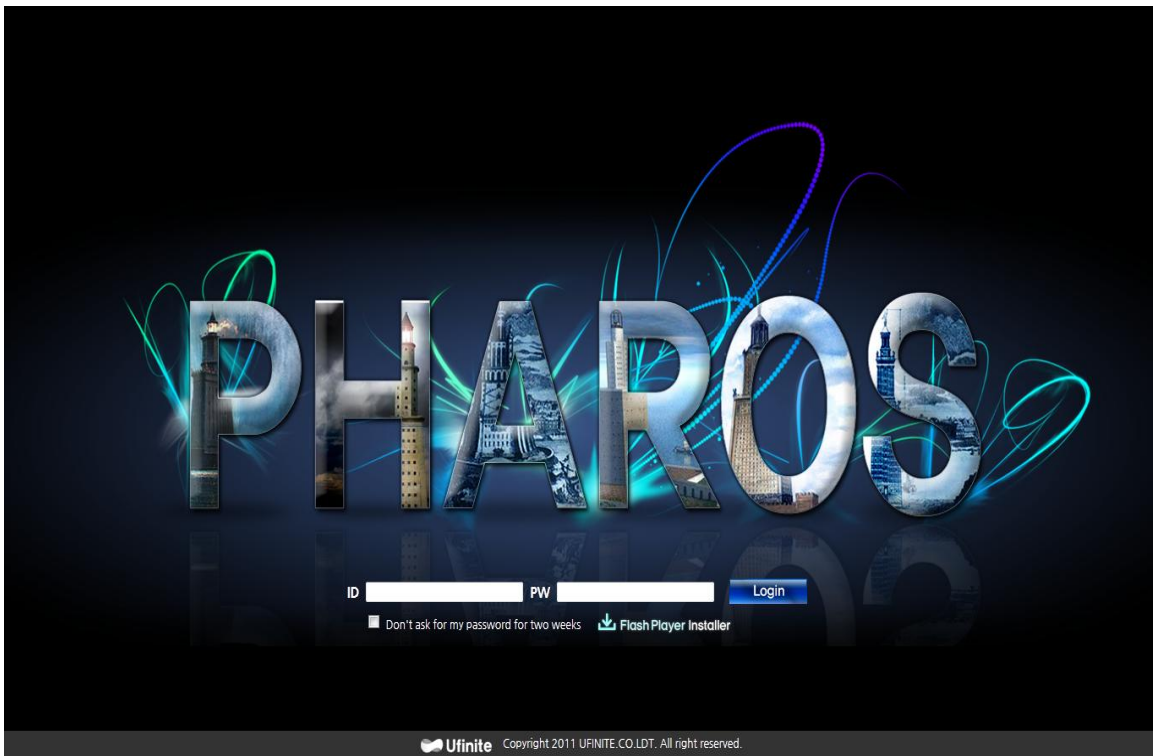
[그림] 3-30 Pharos TP UI 로그인 화면

수집서버가 정상적으로 실행되고 에이전트를 적용시킨 대상 TP가 기동 되었다면, UI에 접속하여 모니터링 화면으로 에이전트 설치가 제대로 되었는지 확인하여 본다. 웹 브라우저를 열어 http://{PharosServerIP}:45000 에 접속하면 아래와 같이 Pharos TP UI를 확인 할 수 있다. User ID/Password 에 admin/admin 을 입력하고 로그인 하여 사용자 화면이 정상적으로 보여지면 정상적으로 설치가 된 것이다.